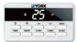
Wire Remote Controller